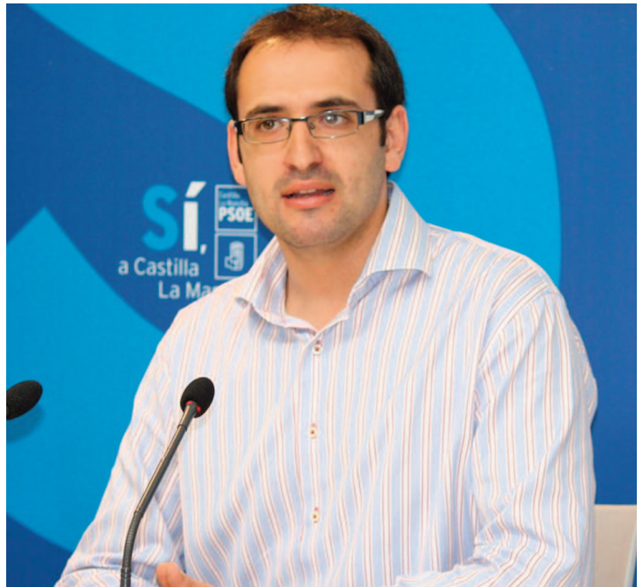
Sergio Gutiérrez, secretario general de Juventudes Socialistas de España.

Sergio Gutiérrez, secretario general de JSE asegura que “quien ha traicionado realmente a los jóvenes es el Partido Popular que no ha desarrollado, en las Comunidades en las que gobierna, ni un solo plan de empleo juvenil. Algo que sí han hecho las Comunidades gobernadas por el PSOE que han invertido más de 3.000 millones de euros para fomentar el empleo entre los jóvenes”. Además, según Gu-