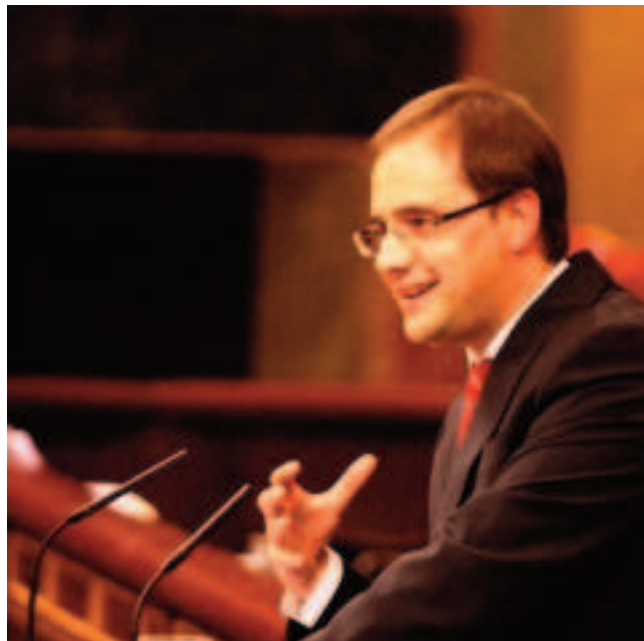
César Luena en el Congreso

A la pregunta de Luena sobre cómo valora el Gobierno la