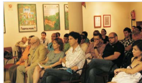
Imagen del público asistente al acto