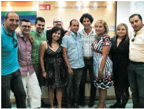
Algunos asistentes al acto junto con los dos ponentes

El pasado jueves, 1 de Julio, se celebró en las Agrupación de Distrito Centro del PSM, con motivo de la celebración de la semana del Orgullo LGTB, un acto sobre la “Situación de los Derechos LGTB en Latinoamérica”, en el que se analizó de manera especial el caso de Honduras.