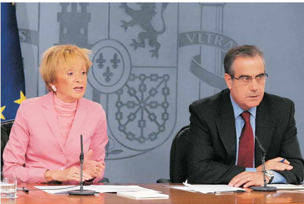
Mª Teresa Fernández de la Vega y Celestino Corbacho en la rueda de prensa tras la aprobación del decreto

Por último, desde JSE han querido señalar que en materia de bonificaciones de cuotas empresariales, se concentran en los jóvenes de hasta 30 años sin formación como colectivo de especial atención. Todos estos esfuerzos se unen a los ya realizados, según JSE, a través del Plan E y de los programas de formación y cualificación para jóvenes, hecho que demuestra que tenemos un Gobierno comprometido con una generación que necesita nuevas oportunidades tras la caída de la era del ladrillo.