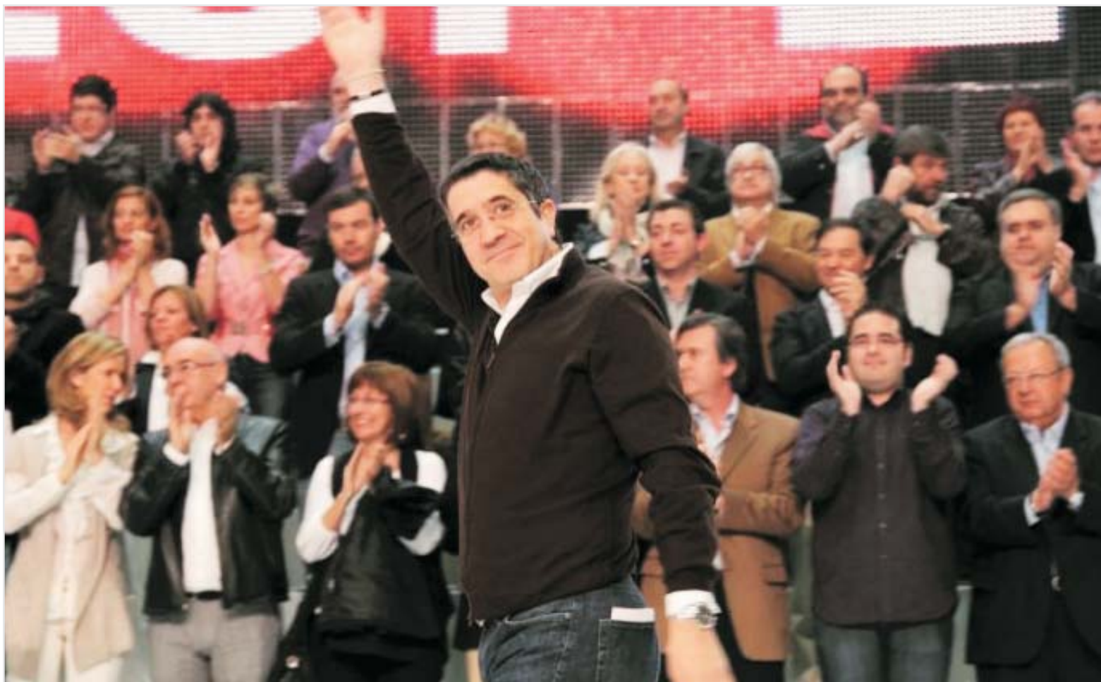
Patxi López momentos antes de iniciar su intervención

Multitud de compañeros de diferentes Federaciones de JSE quisieron acompañar a Juventudes Socialistas de Euskadi-Egaz y al conjunto de los socialistas vascos en la celebración de la Fiesta de la Rosa que tuvo lugar el pasado día 9 en Barakaldo (Vizcaya).