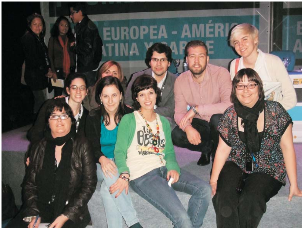
Algunos miembros de la delegación de JSE acompañados por los representantes de IUSY, CJE y OIJ

La I Cumbre Joven Unión Europea, América Latina y Caribe, que se celebró los 7, 8 y 9 de mayo, fue el precedente a la Cumbre de Jefes de Estado y de Gobierno que tendrá lugar el 18 de mayo en Madrid, y ha sido una oportunidad importante para que las organizaciones juveniles de Europa, América Latina y el Caribe pudiesen abordar los retos claves y reforzar el diálogo y la cooperación entre estas regiones en torno a cuestiones regionales y globales, contribuyendo de este modo al desarrollo de la asociación estratégica UE-ALC.