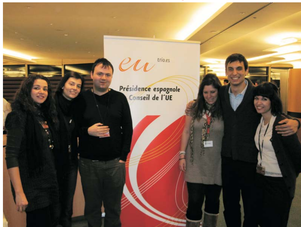
Militantes de JSE-EU durante un acto organizado por la Presidencia Española

2010 será un año, sin duda, de interesante actividad para las JSE-EU, puesto que tendrá lugar, durante su primer semestre, la Presidencia Española de la Unión, hecho de gran relevancia ante el panorama actual internacional, donde los gobiernos socialistas a nivel europeo son actualmente un estandarte, un punto de referencia a nivel global. Momento en que España será la imagen de la Unión Europea ante el resto del mundo, y en el que podrán mostrar al plano internacional los principios y valores que rigen en el gobierno socialista de Rodríguez Zapatero.