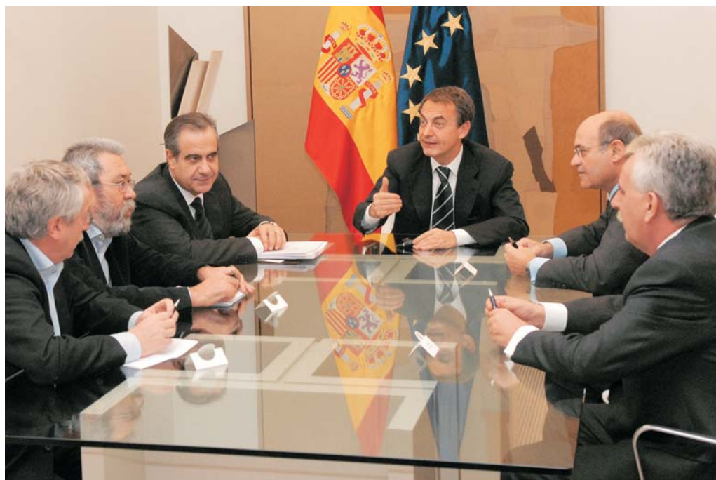
Imagen de la reunión con los agentes sociales

La solución a este problema no es reducir los derechos de los trabajadores, sino “insistir en la necesidad de poner en marcha un cambio en nuestro modelo productivo y de relaciones laborales que prime la formación y la cualificación de los empleados