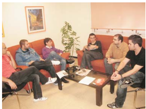
Imegn de uno de los grupos de trabajo

Los diferentes grupos de trabajo que se han venido conformando a nivel federal mantuvieron reuniones simultáneas en Madrid el pasado sábado 19.