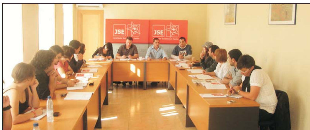
Imagen de la reunión del Consejo Federal de Educación

El pasado sábado 19 se reunió el Consejo Federal de Educación con dos temas principales en su agenda.