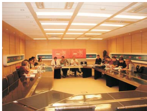
Imagen de la reunión de la CEF