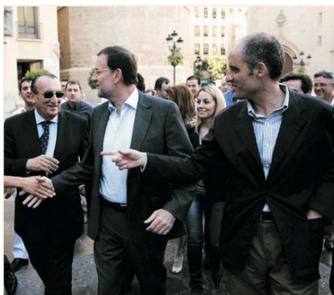
Fabra, Rajoy y Camps

Juventudes Socialistas de España (JSE) ha pedido al presidente de Nuevas Generaciones del PP, Ignacio Uriarte, que demuestre su preocupación por la “decencia” y la democracia exigiendo dentro de su propio partido la dimisión de Esperanza Aguirre, de Francisco Camps y de todos los implicados en el caso Gürtel y en la trama del espionaje de Madrid, así como aquellos que se dedican a acusar a los miembros del Gobierno de realizar prácticas ilegales sin ningún tipo de pruebas, tal y como ha hecho M a Dolores de Cospedal.